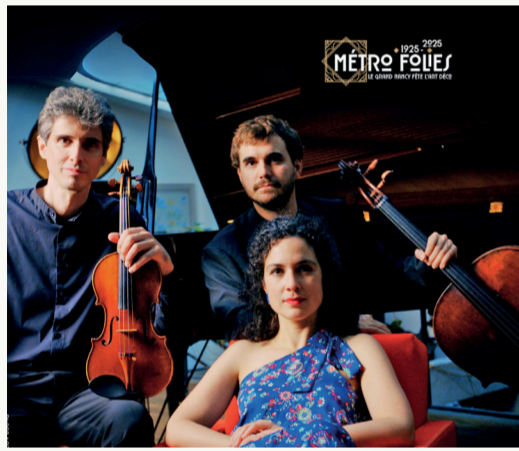
© Association Lorraine de Musique de Chambre

Avec l'Association Lorraine de Musique de Chambre