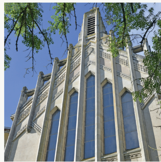
Domaine de l'Asnée / Villers-lès-Nancy