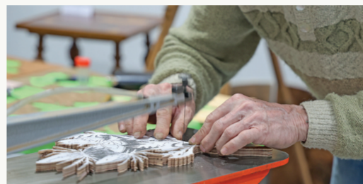
Métropole du Grand Nancy / © Adeline Schumacker

À l'occasion des Journées Européennes des Métiers d'Art, organisées par l'Institut pour les Savoir-Faire Français, venez explorer les Métiers d'Art d'aujourd'hui. Le thème de l'édition 2025, « Traits d'union », célèbre le lien qui nous unit : artisans, publics et collectivités, autour de la passion commune pour l'artisanat. Au programme : visites, conférences, ateliers et rencontres avec les artisans locaux, pour découvrir la richesse et la diversité de leurs créations.